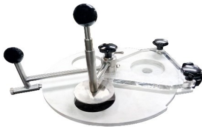
ÚTIL PARA HAMBURGUESAS